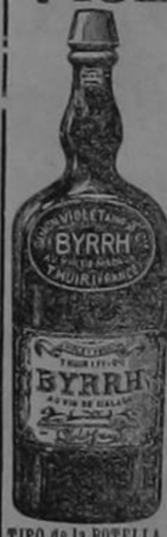
TIPO de la BOTELLA

El BYRRH es una bebida sabrosa, eminentemente tónica y aperitiva. Está hecho con vinos tintos añejos excepcionalmente generosos, puestos en contacto con quina y otras substancias amargas de primera calidad. Toma de todas estas substancias un aroma agradable y preciosas propiedades cordiales y febrífugas, y debe á los vinos naturales que solos sirven para su preparación su notable superioridad higiénica.